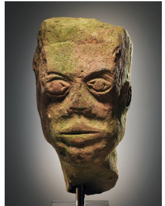
KELTISCHER KOPF. H. 38 cm. Sandstein. Keltisch, ca. 1.-2. Jh. n. Chr. oder später. PAS Datenbank Nummer LVPL-79EA4E. Verkauft von Cahn International an der Biennale Paris 2017.