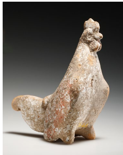
HAHN. H. 12,5 cm. Ton. Matrizengeformte Terrakotta-statuetten, innen hohl. Der Hahn sitzt aufrecht mit hochgerecktem Hals. Oberfläche bestossen. Ockerfarbener Ton mit rötlichen und weissen Farbspuren. Ehem. The Fine Arts Museum, San Francisco, USA, erworben im späten 19. oder frühen 20. Jh. Verkauft zugunsten des Acquisition Fund. Ein altes Nummernetikett sowie zwei handschriftliche Inventarnummern auf der Unterseite der Statuette. Griechisch, 5. Jh. v. Chr. CHF 1'200