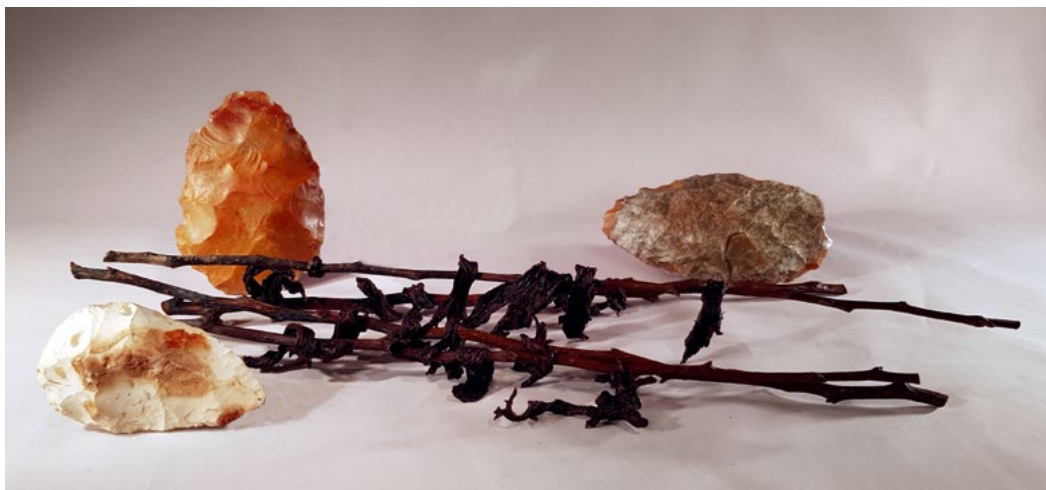
Geräuchertes Pferdefleisch umgeben von SILEX-FAUSTKEILEN aus dem Alt- bis Mittelpaläolithikum, ca. 600'000-40'000 B.P. Von links nach rechts: L. 11 cm, CHF 1'500, L. 13,3 cm, CHF 2'000, L. 14,6 cm, CHF 1'800.

«Meine Definition des Menschen lautet, dass er ein «kochendes Tier» ist. Tiere haben in gewissem Grade Gedächtnis, Urteil und alle Fähigkeiten wie auch Leidenschaften unseres Geistes; aber kein Tier kann kochen», schreibt James Boswell am 15. August 1773 in seinem Tagebuch, sich an ein scherzhaftes Gespräch unter Freunden über das Wesen den Menschen erinnernd. ( A Journal of a Tour to the Hebrides , 1785, 16).