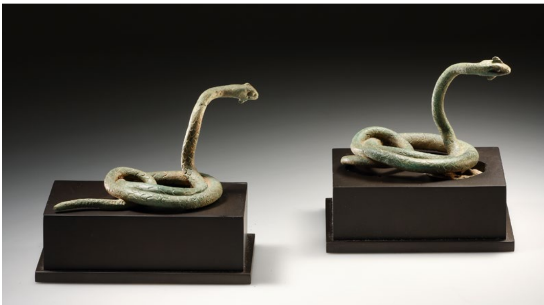
BRONZE-VOTIV: BÄRTIGES SCHLANGENPAAR IN ANGRIFFSHALTUNG. L. max. 11,5 cm. Griechisch, um 450 v. Chr. CHF 26'000

Sind die regelmässigen Schuppungen der Haut – auf der Oberseite spitzoval und versetzt eingeritzt, unten in parallelen Rippen – nun Abbild der Realität oder Dekor und Oberflächenreiz der Bronze? Es trifft wohl beides zu. Das hat auch mit der Zeitstellung zu tun.