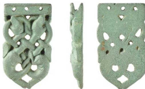
Angelsächsische Gurtbeschläge im Winchester-Stil aus Dorset, Kupferlegierung, (PAS: DEV-264F62), vom PAS dokumentiert.

zwei oder mehr zusammen gefunden wurden, als Treasure , wenn sie mindestens 300 Jahre alt sind. Ab einer Hortgrösse von zehn Münzen gelten auch solche aus unedlen Metallen als Treasure . Alle weiteren Gegenstände, die zusammen mit einem Treasure gefunden wurden, gelten als potentiell Treasure . Dasselbe trifft zu für prähistorische Ensembles aus unedlen Metallen sowie für Funde, die als Treasure Trove bezeichnet werden.