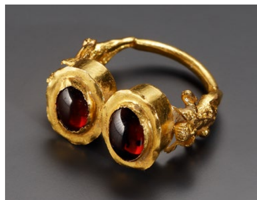
PRACHTVOLLER FINGERRING MIT EROTEN. H. 2,4 cm. Gold, Granat. Der rundgebogene Reif läuft zu beiden Enden hin in detailreich gearbeitete Eros-Statuetten aus. Der Gott ist, wie so häufig, als nackter, geflügelter Knabe mit rundlichen Körperproportionen wiedergegeben. Sein linker Arm ist erhoben; die rechte Hand balanciert eine Kugel. An Kopf und Flügelspitzen angrenzend eine Doppelfassung, bestehend aus zwei miteinander verbundenen, kastenförmigen Elementen ovaler Form, in die jeweils ein Granatacabochon eingefasst ist. Die Darstellung des Eros als nackter, geflügelter Knabe mit etwas fülligeren Körperproportionen bildet in spätclassischer und hellenistischer Zeit ein beliebtes Motiv und begegnet insbesondere in der Goldschmiedekunst. Ein Eros mit minimaler Fehlstelle in der Oberfläche, sonst intakt. Ehem. Privatslg. London, im Familienbesitz seit den 1970er Jahren. Griechisch, spätes 4.-2. Jh. v. Chr. CHF 8'800