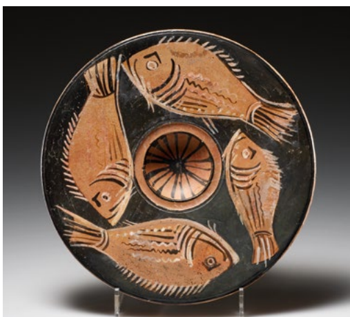
FISCHTELLER. Dm 18,6 cm. Ton, weisse und rosa Farbe. Flacher Teller auf kurzem Standfuss mit weit überhängender Lippe, deren Aussenseite ein Wellenband schmückt. In rotfiguriger Technik vier Brassen gegen den Uhrzeigersinn um die Mitte schwimmend. Rosette in der Mittelvertiefung. Aus grossen Fragmenten zusammengesetzt. Ehem. Privatslg. L.A. County, USA, erworben vor 2000. Westgriechisch, apulisch, ca. 340-320 v. Chr. CHF 8'800