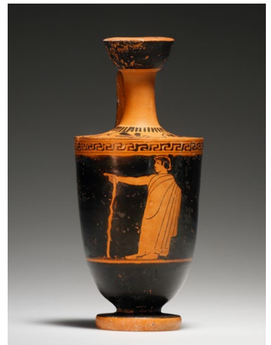
ROTFIGURIGE LEKYTHOS. H. 11,4 cm. Ton. Gefäss mit schlankem Hals, Trompetenmündung, leicht ausladendem Körper und Tellerfuss (Petit-Palais-Typus). Auf der Schulter Strichfries und vier Palmetten. Der Gefässkörper nach oben durch ein umlaufendes Mäanderband begrenzt. Manteljüngling mit Knotenstock nach links. Weisse Binde im Haar. Die Gesichtszüge mit dem schweren Kinn sind typisch für den sog. Strengen Stil. Kleinere Bestossungen retuschiert, partiell Farbabrieb. Ehem. Nachlass einer Schweizer Privatsammlerin, erworben 1987 bei Fortuna, Zürich. Attisch, um 480 v. Chr. CHF 2'800