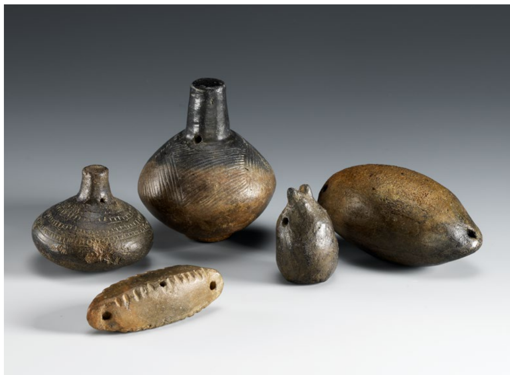
Tonrasseln der Schlesischen Lausitzer Kultur, späte Bronze- bis frühe Eisenzeit, ca. 1. Hälfte 1. Jt. v. Chr. Hinten, von links nach rechts: ZWIEBELFÖRMIGE RASSEL. H. 4,4 cm. CHF 1'200. GEFÄSSFÖRMIGE RASSEL. H. 7,3 cm. CHF 1'800. ZWEI RASSELN. H. 4,5 cm, bzw. L. 8,5 cm. CHF 2'400. Vorne: KISSENFÖRMIGE RASSEL. L. 6,8 cm. CHF 1'800. Alle ehem. Slg. Siegfried Zimmer, um 1950.

Im ersten Moment präsentieren sich vorgeschichtliche Sachverhalte oft befremdlich statisch und entkoppelt von der Sinneswelt: unbeweglich, geruch- und geräuschlos. Neben der fossilisierten und lückenhaften archäologischen Situation führt das Fehlen von Schrift zudem dazu, dass die Umstände nicht einmal über Texte nachvollziehbar sind. Dennoch sind wenige archäologische Objektkategorien überliefert, die einen Zugang zur bewusst erzeugten und erlebten Geräuschwelt eröffnen – so etwa Rasseln, also Rhythmusinstrumente.