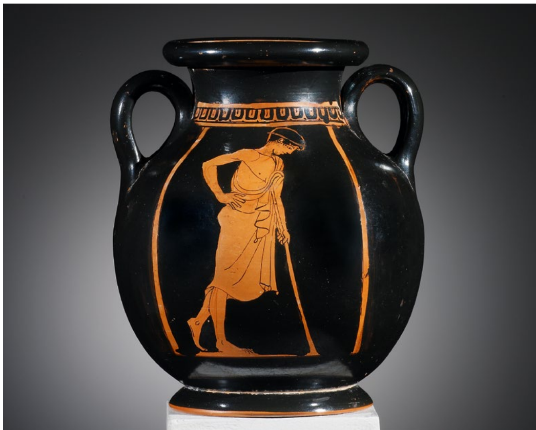
ROTFIGURIGE PELIKE. H. 14,4 cm. Ton. Attisch, 2. Hälfte 5. Jh. v. Chr.