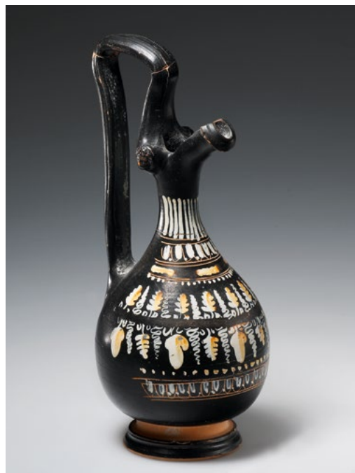
EPICHYSIS (GNATHIA-GATTUNG). H. 18,3 cm. Ton, schwarzer Glanzton, weisse und gelbe Farbe. Birnenförmig; Schnabelausguss; hoher Schlaufenhenkel; profilierter Fuss. Gegenständiger Weinrankendekor; Ornamentfrieze. Am Henkelansatz Kopffapliken. Körper intakt; Henkelfragment wieder angesetzt. Ehem. Schweizer Kunstmarkt, vor 2014. Westgriechisch, apulisch, 3. Viertel 4.-Anfang 3. Jh. v. Chr. CHF 1'200