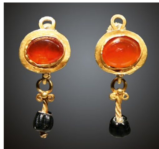
EIN PAAR OHRRINGE. L. 2,9 cm. Karneol, schwarze Glaspaste. Bügelohrringe mit aufgelöteter, querovaler Kastenfassung. Darin eingelassen ein ovaler Karneol mit zur Rückseite abgeschrägter Kante. Anhänger in Form eines kurzen Spiraldrahtes mit aufgezogener Glasperle und Doppelvolute als oberen Abschluss. Das originale Bügelende zur Fixierung eines modernen Steckers umgebogen. Fassungsrand bei einem Ohrring an einer Stelle leicht eingedrückt, sonst hervorragend erhalten. Ehem. Frank Sternberg, Zürich, vor 2000. Römisch, 2.-3. Jh. n. Chr. CHF 2'800