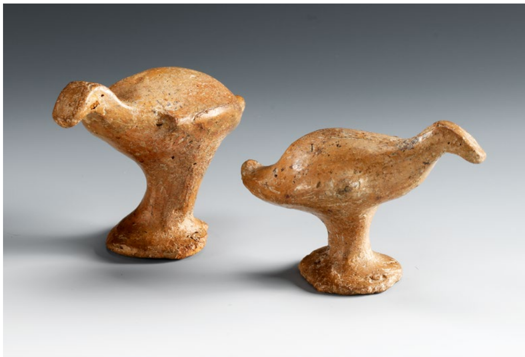
Tonrasseln der Schlesischen Lausitzer Kultur, späte Bronze- bis frühe Eisenzeit, ca. 1. Hälfte 1. Jt. v. Chr. Links: VOGELGESTALTIGE RASSEL. H. 5,5 cm. CHF 2'200. Rechts: VOGELGESTALTIGE RASSEL. H. 4,8 cm. CHF 2'200. Beide ehem. Slg. Siegfried Zimmer, um 1950.

Die Rasseln als einfaches Kinderspielzeug zu interpretieren, greift unter Berücksichtigung der archäologischen Verhältnisse definitiv zu kurz. Sicherlich werden Lausitzer Tonrasseln regelmässig in Kindergräbern gefunden, aber keinesfalls ausschliesslich. So sind durchaus auch Erwachsenengräber mit Rasseln ausgestattet. Wiederum kann die Tatsache, dass Rasseln in den Hinterlassenschaften der Lausitzer Kultur weitestgehend in Grabkontexten entdeckt werden, dage-