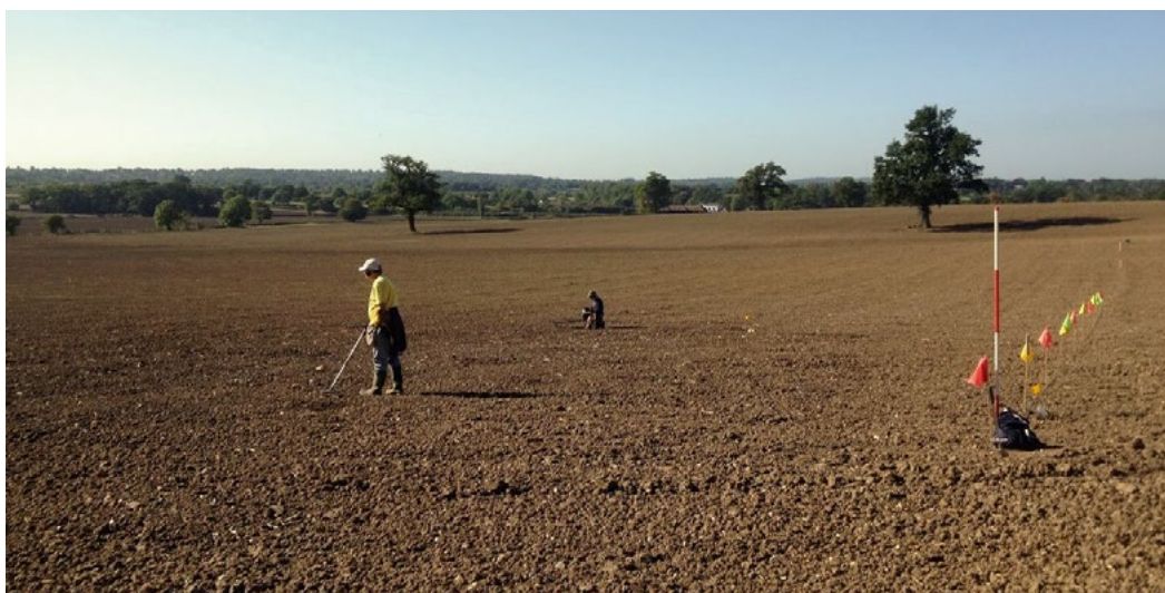
Metalldetektorgänger in Hertfordshire, die an einer archäologischen Kampagne teilnehmen.

Das Altertümer-Gesetz in Grossbritannien zählt zu den liberalsten in Europa. Es ist legal, nach Altertümern zu suchen und da es für archäologische Tätigkeiten keine Zulassungsbeschränkung gibt, kann sich jeder auf diesem Feld betätigen. In England und Wales ist es der Grundbesitzer, nicht der Staat, der normalerweise Anrecht auf den Besitz von Gegenständen hat, die auf seinem Grund gefunden wurden. Es könnte den Anschein haben, dass diese Situation das historische Erbe gefährden würde, doch die letzten 20 Jahre haben ein viel positiveres Bild gezeichnet. Obschon einzelne skrupellos handeln, arbeiten die meisten Personen, die nach archäologischen Gegenständen suchen (in der Regel Metalldetektorgänger) innerhalb der Grenzen des Gesetzes und melden ihre Funde.